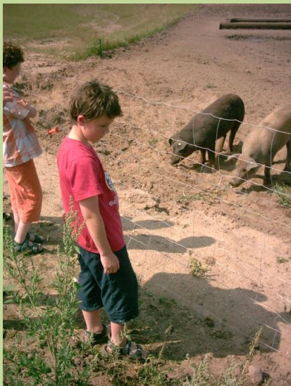
Besuch des Schweinehofes

suchen Schmetterlinge und Raupen, erforschen, warum Heuschrecken Geräusche machen, untersuchen Tiere im Wasser, fotografieren die kleinsten und schönsten Dinge in der Natur, und machen sie zu großen bunten Bildern, machen aus essbaren Pflanzen leckere Sachen zum Probieren, beobachten Vögel, fragen, warum Vögel nach Afrika fliegen, und warum sie zurückkommen (wieso bleiben die nicht gleich da?), schauen nach, wer die Blätter am Waldboden wieder zu Erde macht, entdecken Tierspuren im Winter, spielen lustige Naturspiele, backen Stockbrot und machen Rallyes und suchen nach der Wildkatze Waldemar.